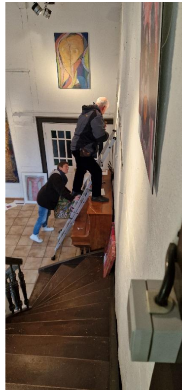
Das Fachwerk, Bad Salzufen